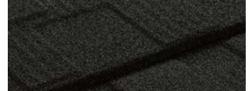
T・ルーフ モダンN シンプルで立体的な表情に